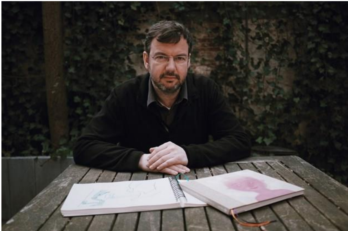
Willem Verheyden

Sommige volwassenen staan wat huiverig rond het thema "dood". Moeten kinderen al met zo'n beladen thema geconfronteerd worden? Het is een feit dat ieder kind vroeg of laat wel met de dood te maken krijgt. Het kan klein verdriet zijn, omdat de kanarie van zijn stokje rolt. Het kan ook veel heftiger worden: opa of oma overlijdt, of iemand uit de straat, of een klasgenootje... In deze voorstelling wordt de dood bij naam genoemd en wordt er fijntjes de spot mee gedreven doorheen troostende en tedere gedichten. Met haar herkenbaar taalgebruik en subtiele luchtigheid weet de auteur in haar poëzie een geheel nieuwe dimensie aan de verschillende facetten van de dood te geven. Gedichten kunnen misschien niet altijd troosten, maar wel nieuwe kanalen openen in je hoofd en je anders naar dingen helpen kijken.